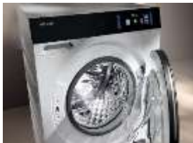
Photo 1 : Miele W2/T2 Nova Edition remporte le prix du public lors du Prix Design Suisse 2025.