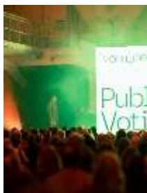
Photo 2 : Le Prix Design Suisse récompense les idées qui conçoivent le design comme une force culturelle, économique et sociale. Le prix du public, qui a été décerné à Miele, distingue les produits qui suscitent particulièrement l'approbation et l'enthousiasme du public.